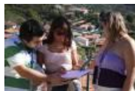
Photo Paper: Atividade de orientação e descoberta em que através de fotografias, os participantes terão que percorrer um determinado percurso, sendo atribuídas determinadas tarefas que terão de ser superadas em equipa.